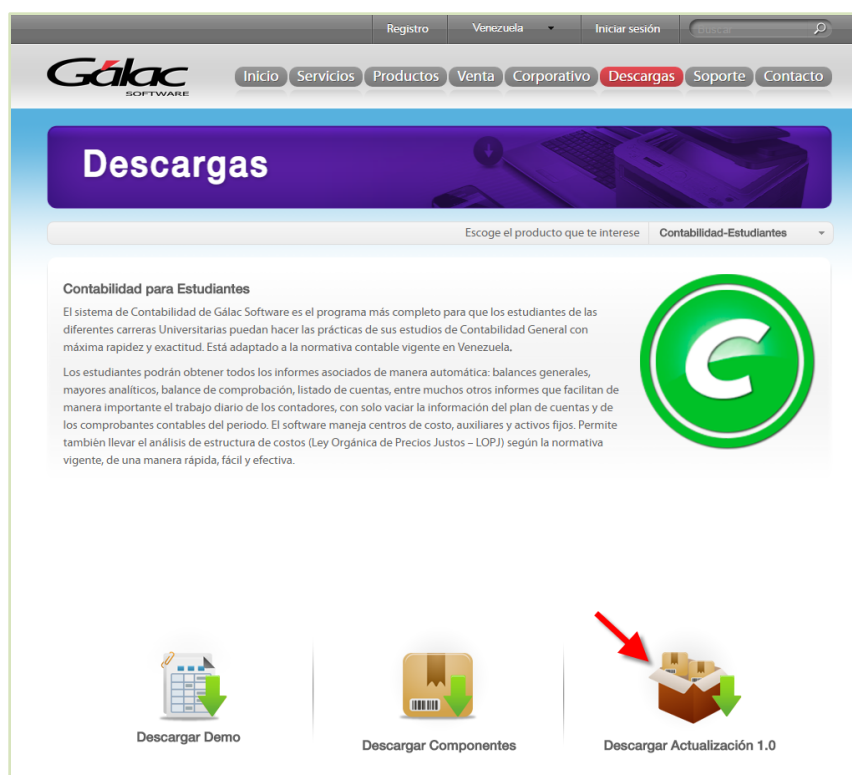
Figura 8. Descarga de contabilidad estudiante

Se habilitará la siguiente ventana, haga clic en Descargar Actualización . Comenzará a descargarse el sistema Contabilidad-Estudiante .