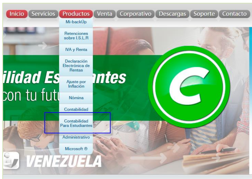
Figura 6. Menú contabilidad estudiante

De igual manera puede llegar a esta página haciendo clic en el menú Productos / Contabilidad Para Estudiantes