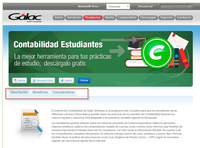
Figura 5. Página contabilidad estudiante