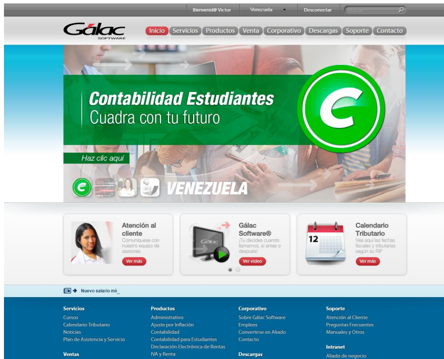
Figura 4. Banner contabilidad estudiante