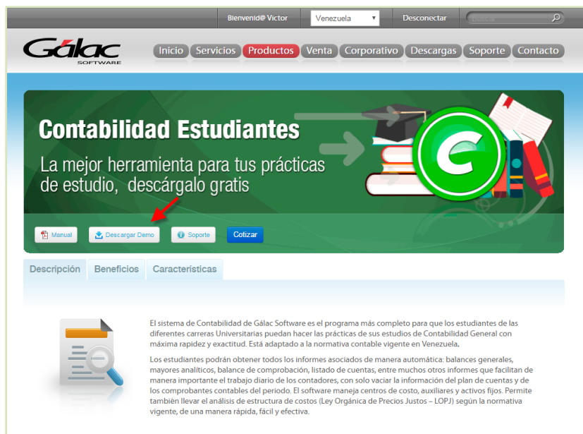
Figura 7. Sección contabilidad estudiante

6. Ahora vuelva a la ventana del Contabilidad-Estudiante y haga clic en Descargar Demo .