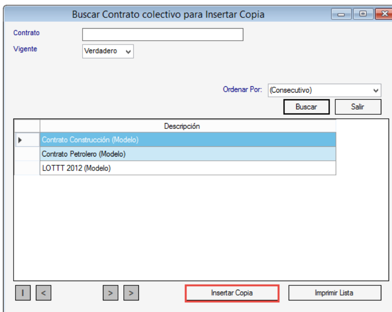
Figura 2. Ventana para buscar y seleccionar el contrato que será copiado.