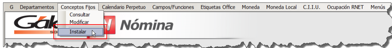
Figura 6. Menú "Conceptos Fijos → Instalar".

Para finalizar, colocar el código 1071 en el campo de Descanso Legal y hacer clic en el botón "Grabar" (no presionar la tecla "Enter") , es decir sin pasarse a otra casilla de concepto.